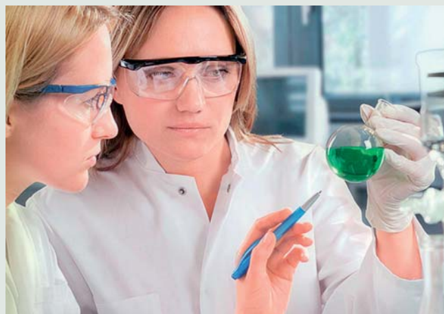
Mladí potravináři v laboratoři